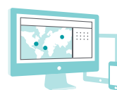
Łatwy i szybki dostęp